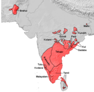
ద్రావిడ భాషల విస్తృతి